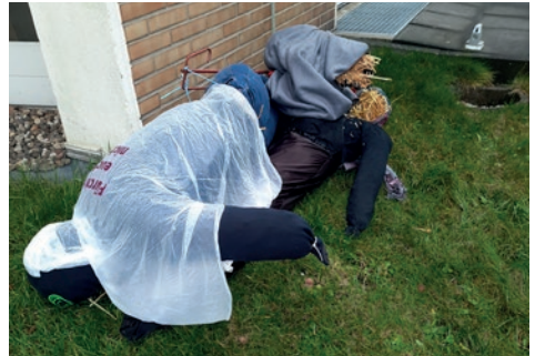
Bild der mutwilligen Beschädigung hatte eine Botschaft, wenn auch eine traurige, aber dennoch realistische:

So ist das wahre Leben! Nicht alles ist und bleibt friedlich in dieser Welt. Maria und Josef durften auch damals mit ihrem neugeborenen Kind nicht im Schutz des Stalls bleiben. Sie mussten fliehen, wurden verfolgt und fanden erst einmal keinen Frieden für die kleine Familie. Und auch heute sind Menschen Gewalt und Willkür ausgesetzt, sind auf der Flucht, die nicht für alle gut ausgeht. Hass, Gewalt und Zerstörungswut gehören zu unserem Leben, den Tieren wird oft grausam das Fell über die Ohren gezogen und viele Menschen bleiben machtlos und einsam auf der Strecke zurück oder verlieren sogar ihr Leben. Das alles machte mir dieses Bild wieder deutlich. Wir leben in einer realen Welt mit all ihren Facetten. Und dennoch kämpfte sich auch bei diesem Erkennen die gute und froh machende Botschaft der Weihnacht durch: Uns ist der Heiland geboren, kein unantastbarer, weltfremder, um den ein Schutzwall errichtet ist, sondern ein verletzlicher, einfacher, der unser Leben mit all seinen Brüchen kennt. Diese Erkenntnis macht den Vandalismus an den Strohfiguren nicht besser, aber es ist die Botschaft, die unzerstörbar bleibt, die das Herz berührt, die mir den Heiland